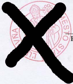
PaedDr. Michal Biganič primátor mesta