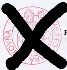
PaedDr. Michal Biganič primátor mesta