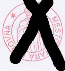
PaedDr. Michal Biganič primátor mesta