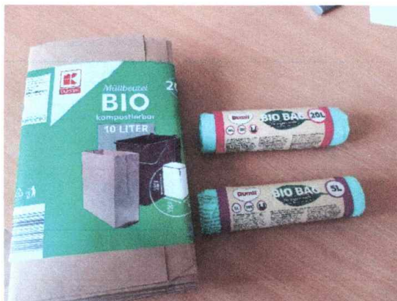
Kompostovateľné Vrecká BIO